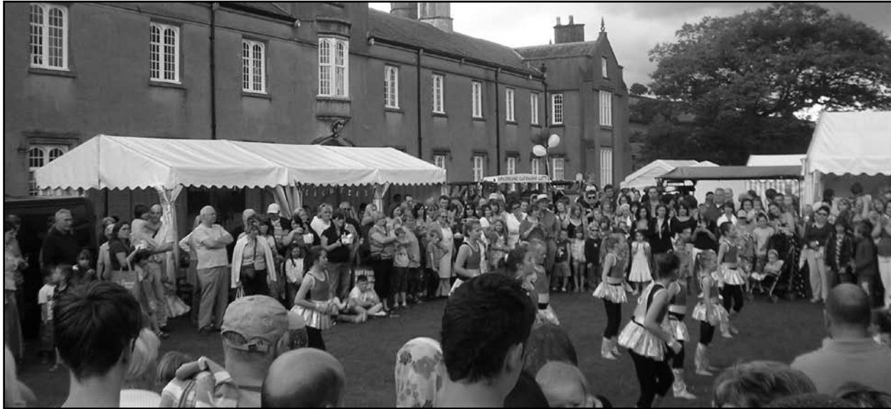
Dawnsywyr Ysgol Ffynnonbedr yn diddanu'r dorf ar dir y coleg adeg Ffair Fwyd Llanbedr Pont Steffan 2009.