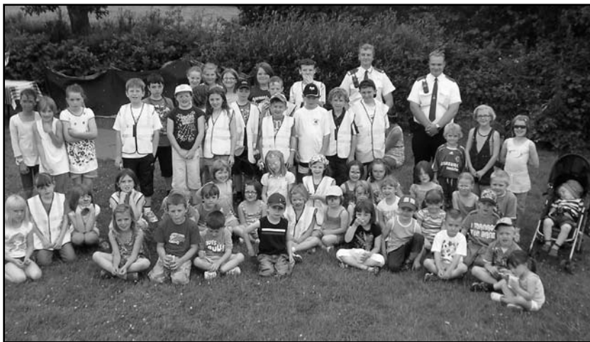
Dyma rai o blant Ysgol Carreg Hirfaen ar ddiwrnod eu Taith Gerdded. Casglwyd swm sylweddol o £1,090.45. Hoffai swyddogion Pwyllgor Rhieni ac Athrawon yr Ysgol ddiolch i bawb am gefnogi.